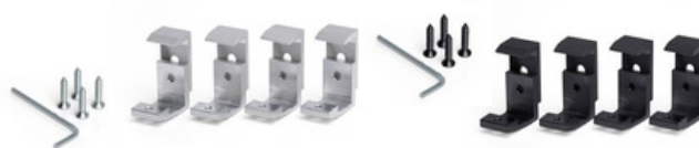
ZACISK ZEWNĘTRZNY - ZESTAW 4 SZT.