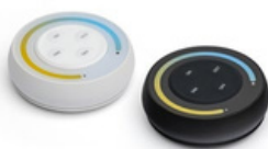
PILOT MAGNETYCZNY S1