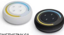
PILOT MAGNETYCZNY S1