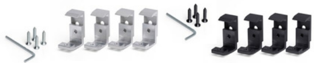
ZACISK ZEWNĘTRZNY - ZESTAW 4 SZT.